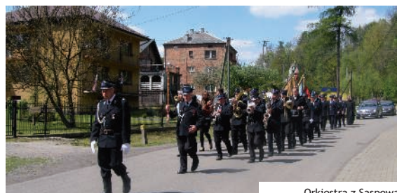
Orkiestra z Saspowa