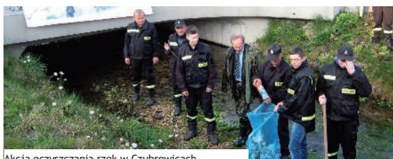
Akcja oczyszczania rzek w Czubowicach