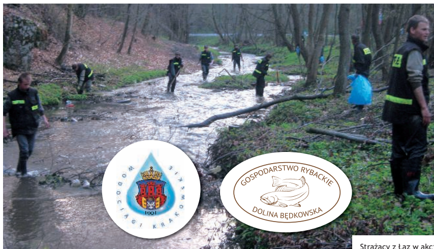
Strażacy z Łaz w akcji