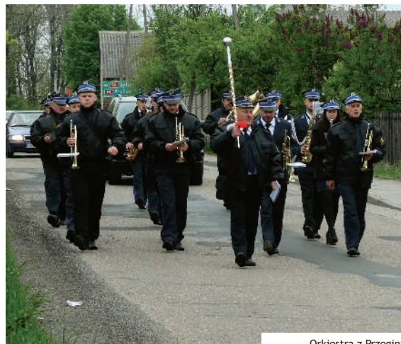
Orkiestra z Przegini