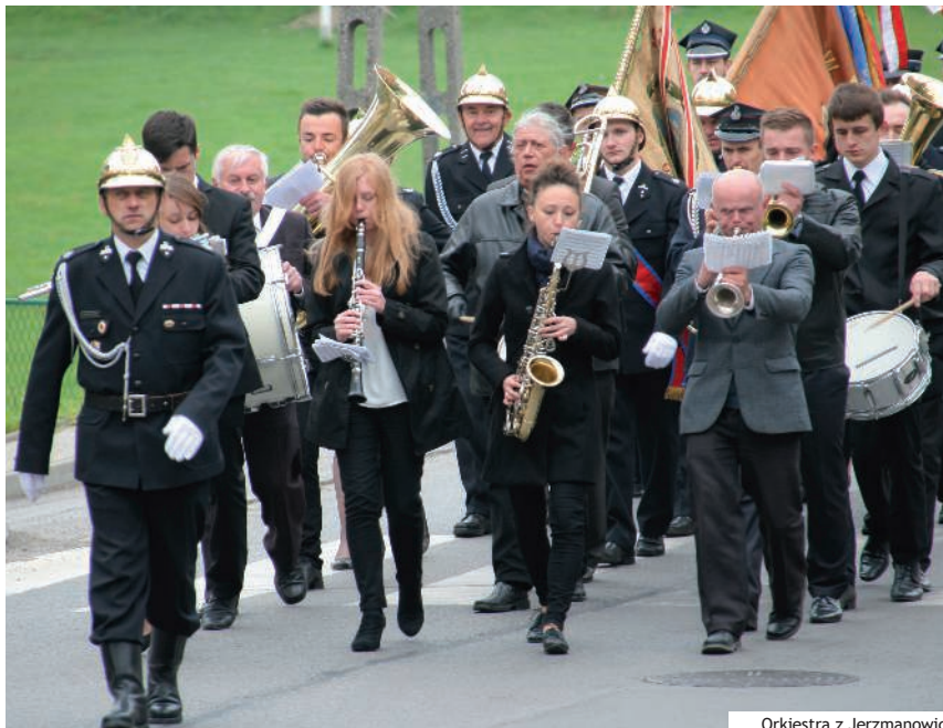
Orkiestra z Jerzmanowic