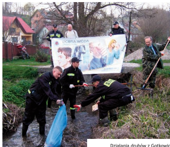
Działania druhów z Gotkowic