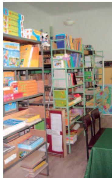
Pomieszczenia szkolnej biblioteki

W placówce zaszły wielkie zmiany, ale ich koszt nie był wielki. Szkoła wydała pieniądze tylko na materiały konieczne do remontu, fachowa praca była darmowa. Pod-