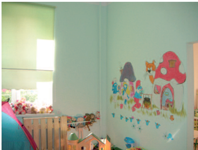
Wyremontowana sala przedszkola

Saspów był pierwszy. Już w trakcie wakacji dzięki darmowej pracy osadzonych zostały wyremontowane przedszkolne pomieszczenia w budynku szkolnym. Kiedy przejmowałam stanowisko dyrektora w Przedszkolu Samorządowym, byłam pełna obaw, pamiętałam, jak sytuacja wyglądała na początku wakacji, gdy odchodziłam na urlop –