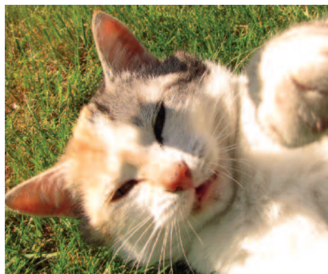
▲ Iza Gąska, kl. 3, Gimnazjum Jerzmanowice