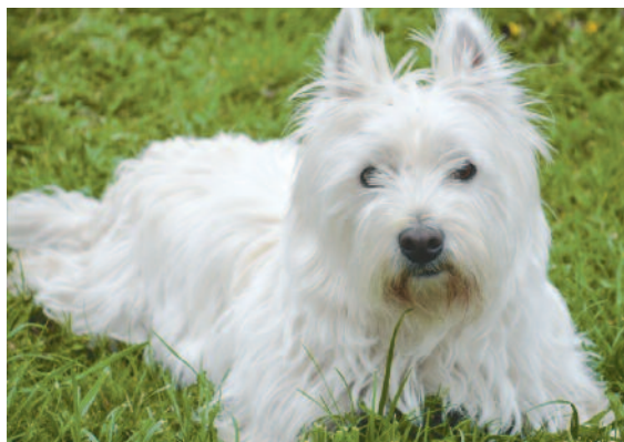
▲ Oliwia Kaczmarczyk-Rusek, kl. 3, SP Sąspów