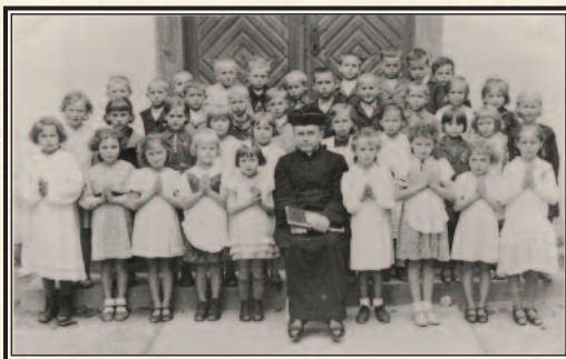
Potwierdzenie pierwszej Spowiedzi św., 1942 r.