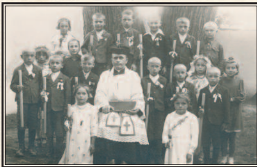
Pamiętka I Komunii św., 1943 r.

Przy okazji można wspomnieć, że ksiądz proboszcz był gospodarzem na 6 morgach ziemi parafialnej (przed konfiskatą