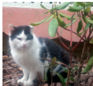
Aleksander Zając, Przedszkole Przeginia