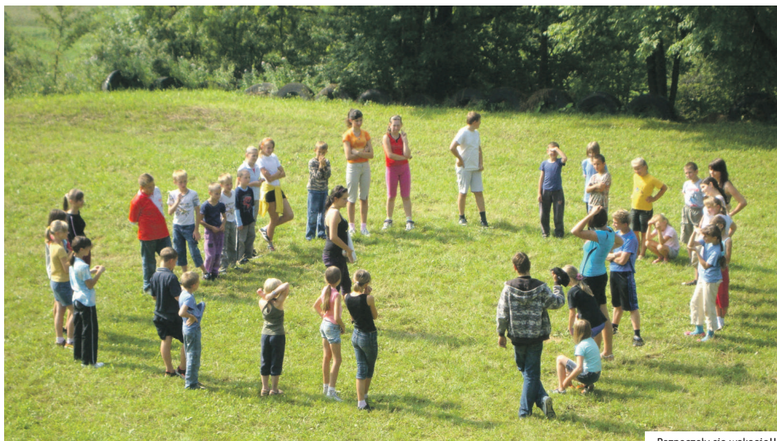
Rozpoczęły się wakacje!!!