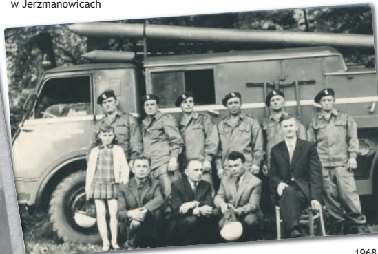
1968. Drużyna strażaków z Jerzmanowic na zawodach strażackich w Ojcowie