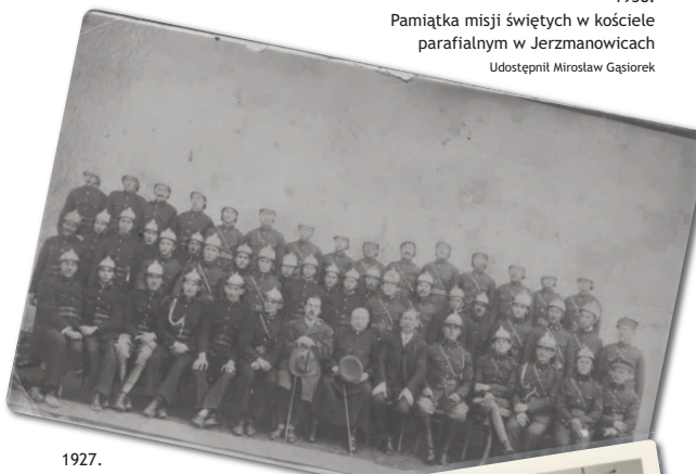
1927. Oddziały Ochotniczych Straży Pożarnych z Łaz i Jerzmanowic

Ewentualne pytania dotyczące Cyfrowego Archiwum prosimy zadawać telefonicznie: 12 38 95 043 lub przesyłać na adres e-mail: pigbpjerzmanowice@interia.pl