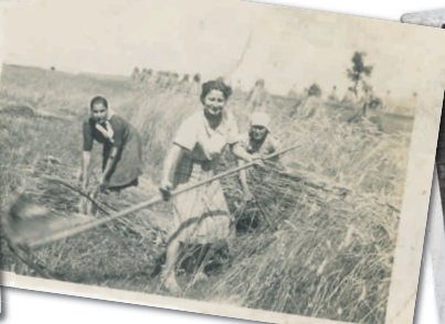
1968. Dożynki w Jerzmanowicach Żniwa w Jerzmanowicach