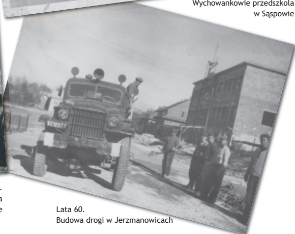
Lata 60. Budowa drogi w Jerzmanowicach