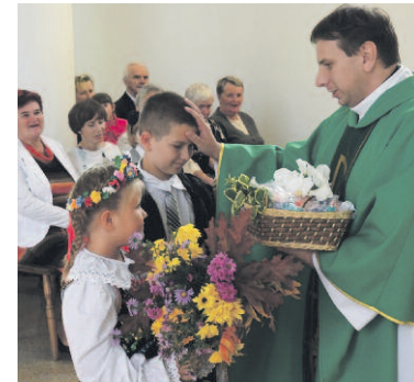
Uroczystość z udziałem księdza misjonarza

Dniu Edukacji Narodowej odbyło się ślubowanie uczniów klas I. Uczniowie wszystkich klas, wraz z najmłodszymi dziećmi, w obecności licznie zgromadzonych rodziców oraz nauczycieli zaprezentowali krótki program artystyczny. Pierwszoklasiści złożyli uroczystą przysięgę