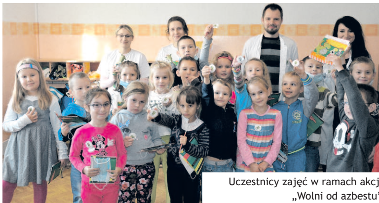
Uczestnicy zajęć w ramach akcji „Wolni od azbestu”