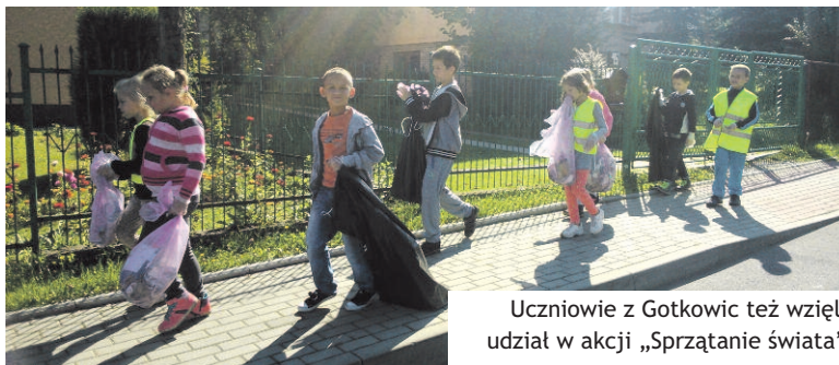
Uczniowie z Gotkowic też wzięli udział w akcji „Sprzątanie świata”