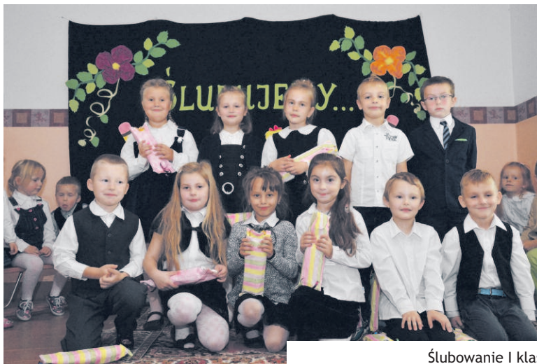
Ślubowanie I klas